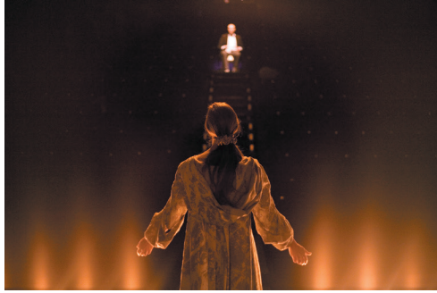
Le Malade imaginaire ou le silence de Molière, Arthur Nauzyciel 1999